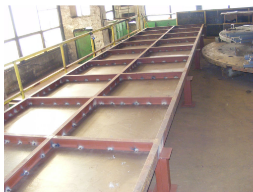
2. Materiale debitate în vederea asamblării stațiilor – 2