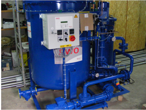
6. Utilaje componente ale stației de epurare compactă