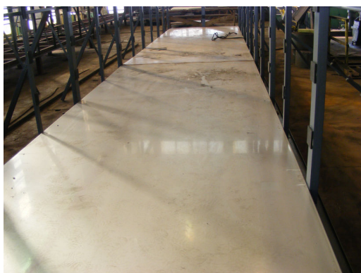
1. Materiale debitate în vederea asamblării stațiilor- 1 2.

Realizare stații de epurare compacte pentru apă-hidrocarburi și tratare ape menajere în cadrul proiectului “Sistem de preluare și prelucrare reziduuri de la nave și intervenție în caz de poluare pe sectorul Dunării administrat de CN APDF SA Giurgiu”, proiect cofinanțat de Comisia Europeană din Fondul European de Dezvoltare Regională prin Programul Operațional Sectorial Transport 2007 – 2013