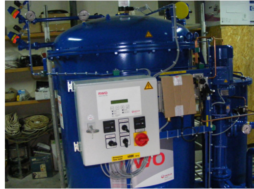
7. Utilaje componente ale stației de epurare compactă