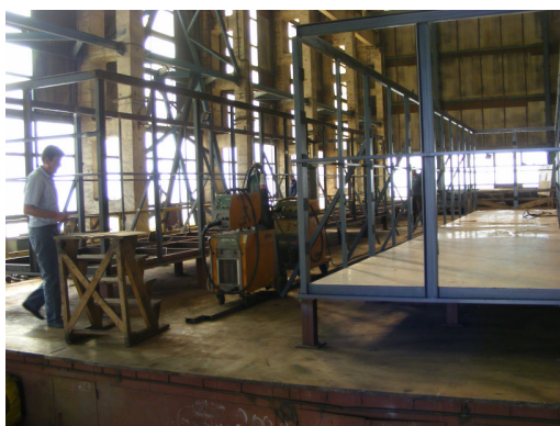
5. Containere în lucru pentru stațiile de epurare compacte