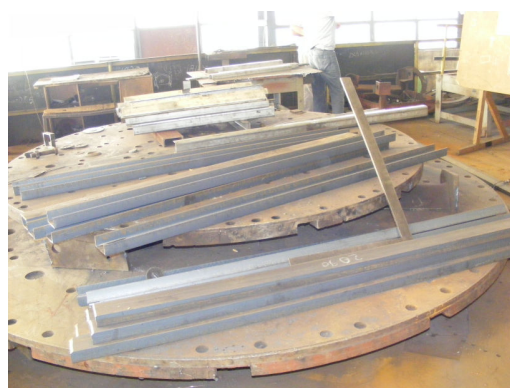
4. Materiale debitate în vederea asamblării stațiilor - 4