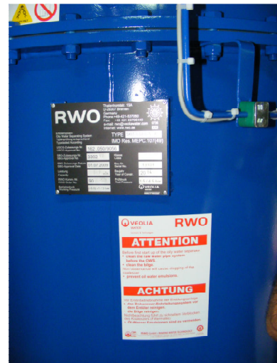
9. Utilaje componente ale stației de epurare compactă