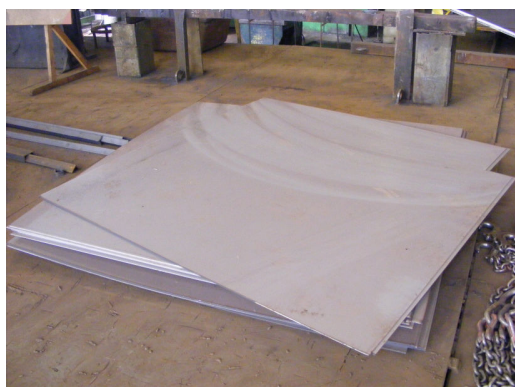
3. Materiale debitate în vederea asamblării stațiilor - 3