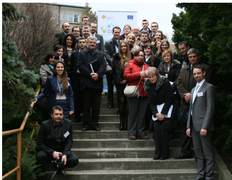
Participanți la cel de-a 2-a ședință a GII, Bratislava

Pe măsură ce proiectul de apropiere de final, accentul este pus din ce în ce mai mult pe dezvoltarea Convenției Internaționale , ceea ce reprezintă obiectivul principal al proiectului. Astfel, cea de-a doua ședință a Grupului Internațional de Implementare a avut loc la Bratislava, pe data de 25 februarie 2014. În afară de furnizarea de informații cu privire la progresul proiectului și stadiul actualizat de implementare, obiectivele ședinței au vizat dezbaterea activă a draft-ului Convenției Internaționale, în cadrul unor grupuri de lucru, pentru clarificarea aspectelor esențiale ale implementării convenției, dar și pentru a permite Consortium-ului proiectului sa ofere recomandări. Înainte de lucrările grupurilor de lucru, în cadrul ședinței au fost realizate prezentări, pentru a putea oferi tuturor participanților un rezumat al rezultatelor proiectului, al progresului general dar și date referitoare la experiențele înregistrate pe parcursul implementării acțiunilor pilot transnaționale de colectare a deșeurilor provenite de la nave.