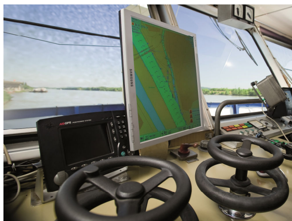
Serviciile de Informare Fluvială – ECDIS

Rezultatele acțiunilor pilot pentru colectarea deșeurilor provenite de la nave, implementate pe parcursul verii în anul 2013, în Austria, Slovacia, Ungaria, Croația, România și Bulgaria, au contribuit la extinderea perspectivelor asupra situației actuale privind gestionarea deșeurilor provenite de la nave pe Dunăre. Pe lângă colectarea datelor privind situația curentă, serviciile gratuite de colectare a deșeurilor provenite de la nave au fost organizate în scopul testării Sistemului Electronic de Vignete (SEV), creat în cadrul proiectului, pentru a sprijini administrarea colectării acestor deșeuri. Mai mult de 150 nave s-au înregistrat pentru a participa la implementarea acțiunii pilot. În perioada iulie – decembrie 2013, peste 400 m 3 apă de santină, 25 m 3 de ulei uzat și 2000 kg de deșeuri solide de hidrocarburi au fost predate la punctele de colectare din țările participante. Atitudinea pozitivă față de această inițiativă este confirmată de numărul mare de participanți, precum și de feedback-ul pozitiv al acestora. Acțiuni pilot sunt încă în derulare în Austria, Croația, România și Bulgaria. În plus față de acțiunile pilot, sondajele despre posibilitățile de gestionare a deșeurilor la bordul navelor și analiza practicilor curente, sprijină configurarea unei rețele de facilități de preluare a deșeurilor provenite de la nave, adaptată cerințelor.