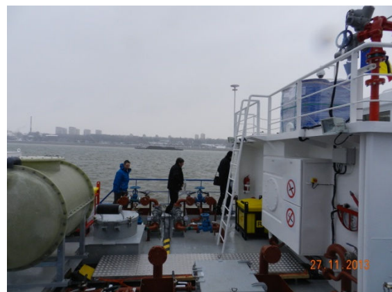
Vizită la nava mobilă de colectare deșeuri, Giurgiu (RO)

La această ședință, versiunea draft a Convenției Internaționale pentru Managementul Deșeurilor pentru Navigația Interioară pe Dunăre a fost prezentată pentru prima dată și a fost discutată în cadrul Consorțiului.