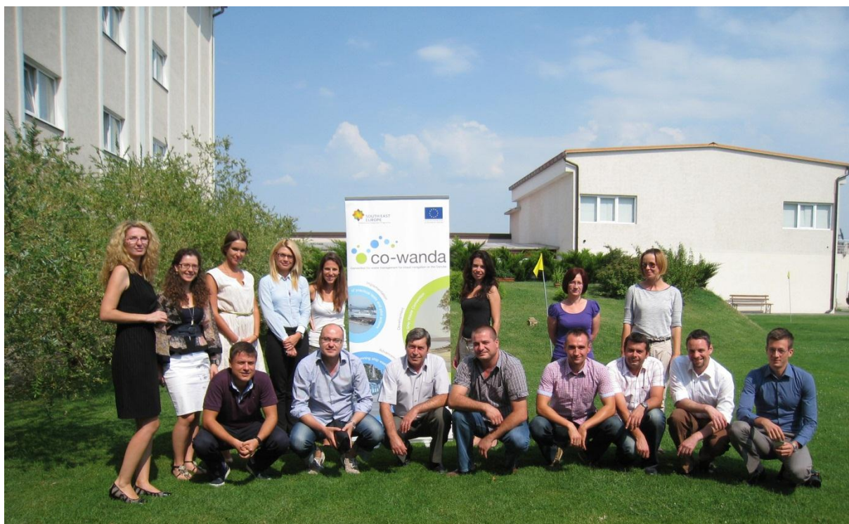
August 2013: Vizită de studiu și întâlnire tehnică în Kladovo, Serbia

deșeuri este gratuită, sunt doar câteva nave fluviale care au profitat de această șansă. Acest lucru se datorează obstacolelor administrative întâmpinate pe Dunăre, ce se reflectă în procedurile care necesită timp și costuri suplimentare. În momentul în care va debuta elaborarea Convenției Internaționale privind Deșeurile Generate de Nave pe Dunăre , se vor analiza în detaliu dificultățile privind cadrul legal, pentru a oferi soluții ce permit livrarea fără obstacole a deșeurilor generate de nave, în toate țările riverane și de către toate navele, indiferent de pavilion.