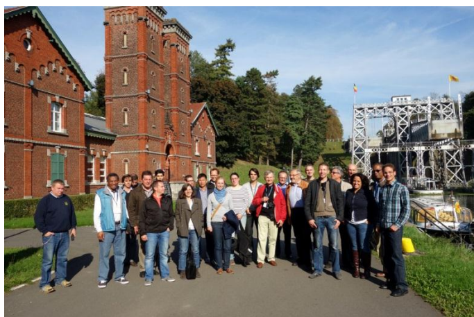
Conferința Smart Rivers 2013

După un an de la startul reușit al proiectului, consorțiul poate fi mândru nu numai pentru munca desfășurată, dar și pentru notorietatea dobândită la nivel internațional. Proiectul a fost promovat la diverse conferințe și evenimente internaționale, precum CONFERINȚA PIANC SMART RIVERS 2013 ce a fost organizată în Maastricht/NL și în Liège/BE, în intervalul 23-27 septembrie 2013. Proiectul CO-WANDA și obiectivele acestuia au fost prezentate către un public internațional format din experți din domeniul navigației internaționale din Europa, Japonia, China și Statele Unite ale Americii.