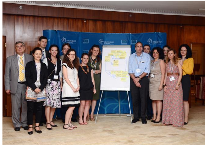
Experții CO-WANDA la primul Workshop al Grupului 9 din București

workshop , parte a seminarului tematic ACCESSIBLE SEE – ce coordonează rezultatele proiectelor SEE pentru îmbunătățirea accesibilității în regiune (Split/HR - 18 septembrie 2013). Au fost colectate sugestii din partea partenerilor de proiecte pentru a fi integrate în dezvoltarea următoarelor programe de finanțare pentru perioada 2014-2020. Informații suplimentare privind grupul 9 pot fi obținute de pe pagina oficială a Programului SEE: www.southeasteurope.net/en/achievements/capitalisation_strategy/ .